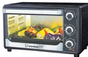
МИНИ-ПЕЧЬ DANKO - 4025