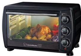
МИНИ-ПЕЧЬ DANKO - 4020