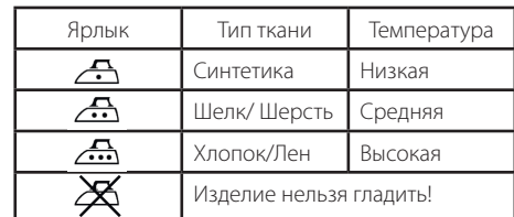
ТАБЛИЦА ТЕМПЕРАТУРНЫХ РЕЖИМОВ ДЛЯ ГЛАЖЕНИЯ РАЗЛИЧНЫХ ВИДОВ ТКАНИ

Первый нагрев: примерно 1-1,5 минуты, непрерывная работа — около минуты.