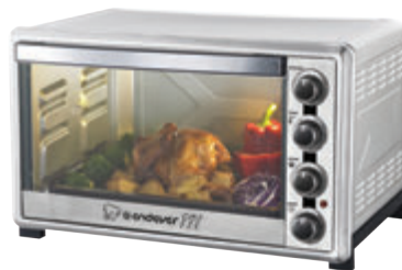
ПЕЧЬ DANKO - 4065